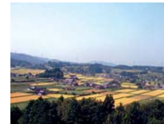
女城主が統治した岩村城と城下町 古きよき時代の 農村風景 が見られます。