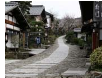
ここ「 馬籠宿 」は中山道木曾路の宿場町です。 (近くには、「妻籠宿」があり、日本で初めて町並保存に取り組みました)