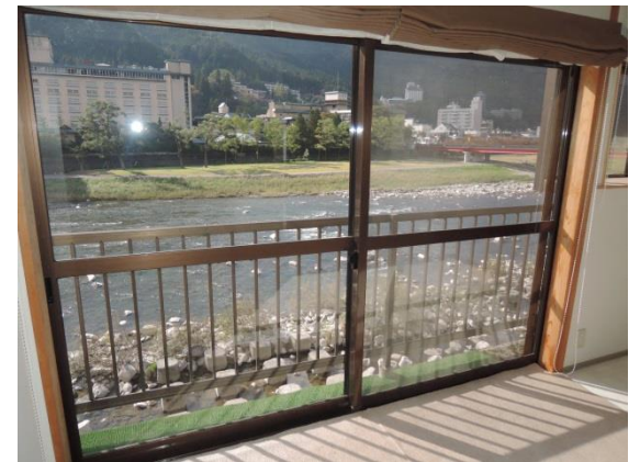
1階 リビングから飛騨川を望む