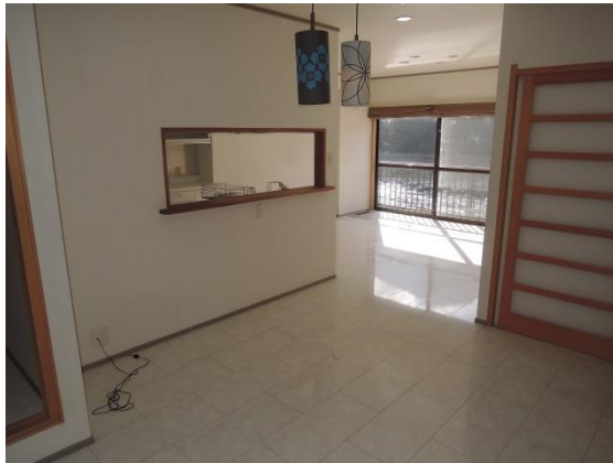
1階 リビング 18畳