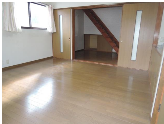
2階 洋間 8畳