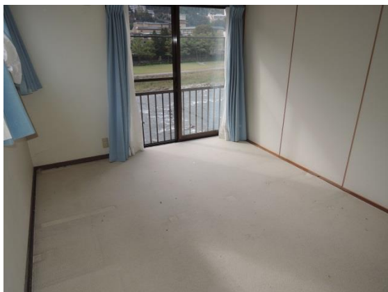
2階 洋間 7.5畳