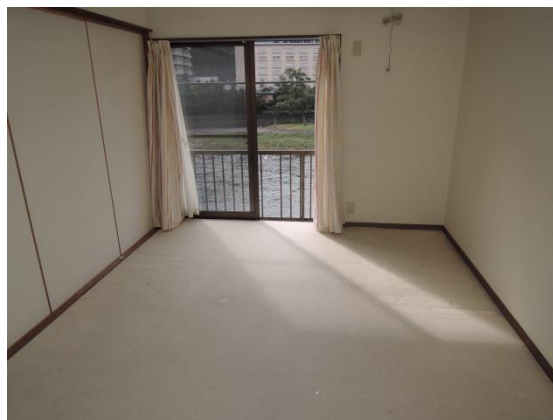
2階 洋間 6.5畳