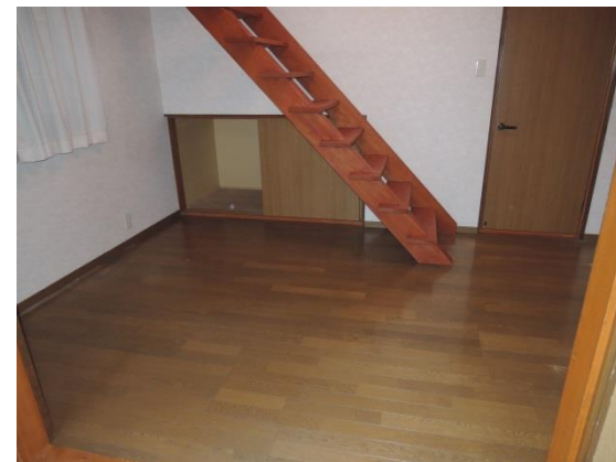
2階 洋間 6畳