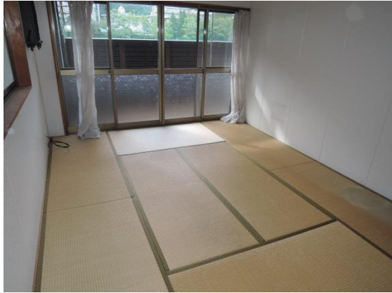
地階 和室 7畳