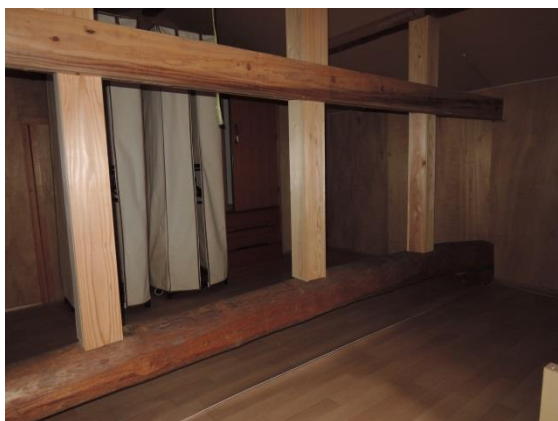
2階 屋根裏 収納