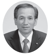
2 番 今井政良議員