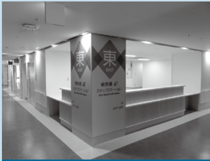
病棟スタッフステーション