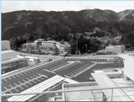
駐車場（一般用 280 台）