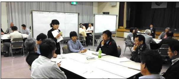
写真は市民ワークショップ（金山会場）の様子です。

市が考える庁舎の一本化に関する市民ワークショップ（参加型の話し合いと意見発表）を5月に市内5会場で開催されました。参加者数等は次のとおりです。発表意見は裏面をご覧ください。