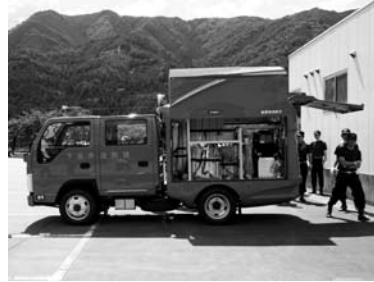
▲消防団から貸与された消防団救助資機材搭載型車両