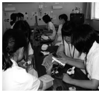
▲看護体験で、血圧測定を体験する参加者

金山病院では、看護師不足が続いており、看護体験を通して関心を高めてもらい、医療や福祉の仕事をめざしてもうえればと期待しています。