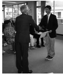
▲8月6日、訪問団が市長を表敬訪問