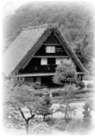
○下呂温泉合掌村事業 (単位：千円)