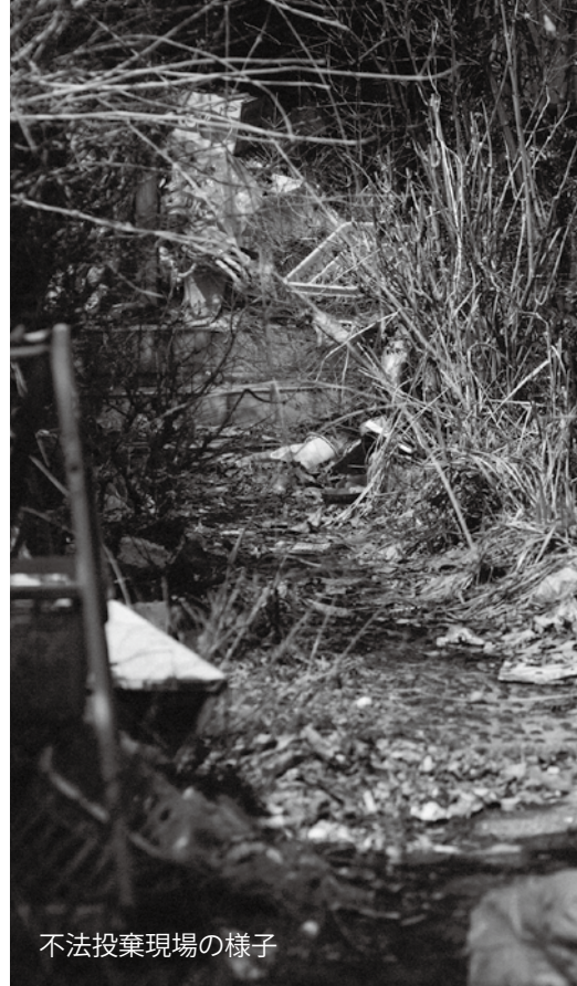
不法投棄現場の様子