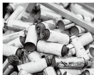
▲使い切らずに捨てられたカセットボンベ

・シューツという音がしなくなるまで、スプレーボタンを押して中身を完全に使い切ってください。 ・中身が残っている場合は、火気のない風通しの良い屋外で、ガス抜きキャップなどを使用してください。 ・ガス抜きをする際には、紙や布などに吹き付けるなどして周囲への飛散にご配慮ください。 ・家屋内での作業は引火の恐れがあります。大変危険ですので絶対に行わないでください！