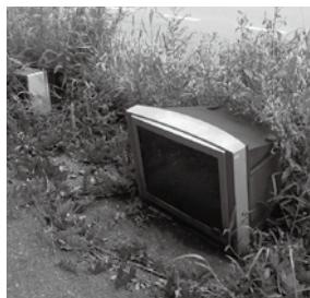
▲テレビなどの不法投棄

不法投棄が判明した場合、投棄物の撤去と適切な処理が命じられるだけではなく、警察に摘発され、法による罰則「5年以下の懲役もしくは1千万円以下の罰金またはこれらの併科」を受けられることになります。引越しや大掃除などで臨時的にごみが大量に出た場合は、直接下呂市クリーンセンターに持ち込むか、下呂市一般廃棄物収集運搬許可業者へ処理を依頼してください。