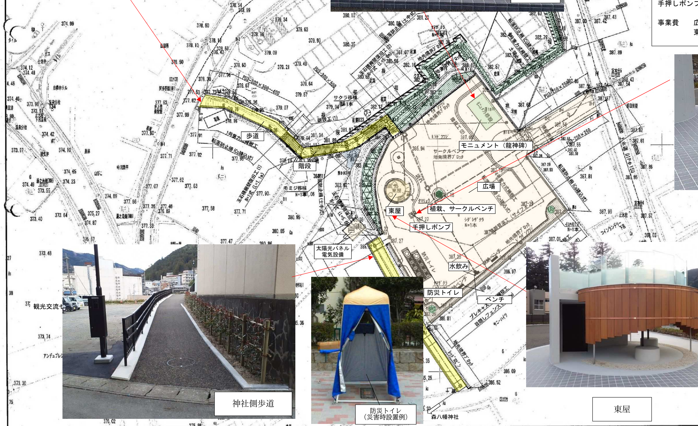
森6号線崩壊部 緑化ブロック・植栽