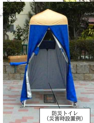
防災トイレ (災害時設置例)