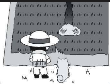
草、木の葉、枝、もみがら、わら等の焼却