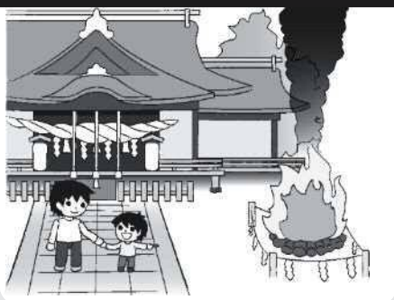
火祭り、どんと焼き等