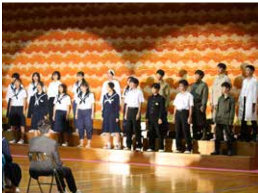
▲参観者の前で合唱を披露する生徒たち＝小坂中学校