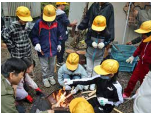
▲火起こし体験をする児童たち＝火打の森キャンプ場