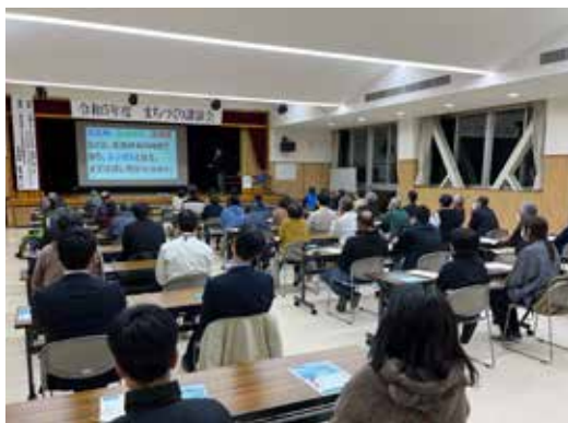
▲熱心に講演を聞き入る参加者たち＝金山市民会館