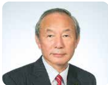
下呂市商工会連絡協議会長

数多くの観光資源を有する県内の市町村を結ぶ道ができることによって広域周遊観光が期待されます。これから整備の始まる郡上市堀越峠から和良地区の濃飛横断自動車道により東海北陸自動車道からのアクセスが向上し、開通予定のリニア中央新幹線とそのアクセス道路が整備されることで、下呂温泉や魅力あふれる自然観光へのさらなる観光客誘致に大きな期待を寄せています。