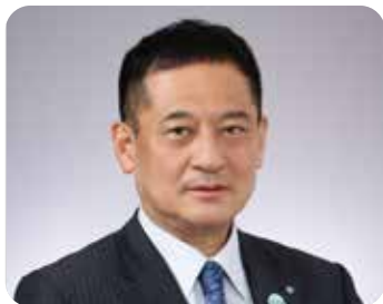
下呂温泉観光協会会長