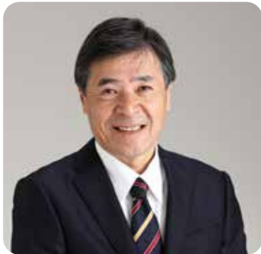
濃飛横断自動車道事業 促進期成同盟会長