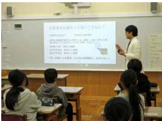
▲医療の話に興味深く耳を傾ける児童ら=金山小学校