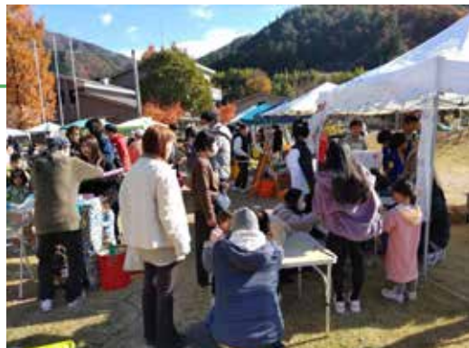
▲お客さんで賑わう中学生コーナー＝小坂きこり公園

小坂きこり公園・きこりセンターで飛騨小坂ふるさとフェスティバルが行われました。今年はオーガニックなマルシェとして地場産の農産物やオーガニックな食材を使った料理、環境負荷に配慮した物品の販売などを行い、たくさんのお客さんでにぎわいました。また、中学生ボランティア9人が「子ども縁日」を企画。1カ月ほど前から放課後に打ち合わせを重ね準備をし、イベントに来た子どもたちに大好評でした。