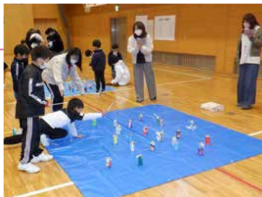
▲軽スポーツを楽しむ参加者たち=萩原小学校体育館

萩原小学校体育館で、小学生を対象とした「萩原子ども会の集い」が開催されました。参加した子どもたちは3人1組のチームを作り、8つの軽スポーツで得点を競いました。チームで話し合い団結し、他地区のチームとスポーツを楽しみながら交流することで、地域の仲がより一層深まりました。また、8種目の他にモルック、ジュニアリーダーによるレクリエーションを体験し、会場全体が笑顔に包まれる素晴らしい時間となりました。