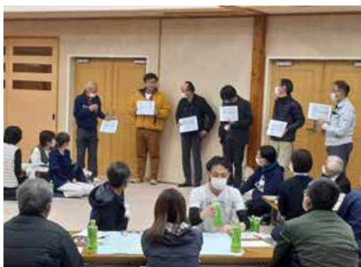
▲グループごとに発表を行う様子＝清流ふれあい会館