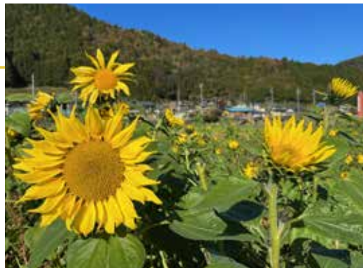
▲季節外れに咲いたひまわり＝金山町井尻地内

11月下旬、金山町金山の井尻交差点（国道41号・県道関金山線）付近で季節外れのひまわりが咲きました。通常は春に種をまき、夏に見ごろを迎える観賞用のひまわり畑ですが、今年は秋になって広範囲にわたって自生のひまわりが再び咲き揃いました。紅葉の進む山を背景に季節外れのひまわりが見られる不時現象は今後も続くのでしょうか？これからの草花の咲き方が注目されます。