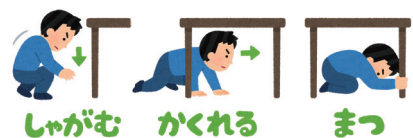
しゃがむ かくれる まつ

同報無線の緊急地震速報に合わせて、下記の三つの動作(安全行動)を行ってください。