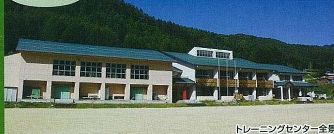
トレーニングセンター全景