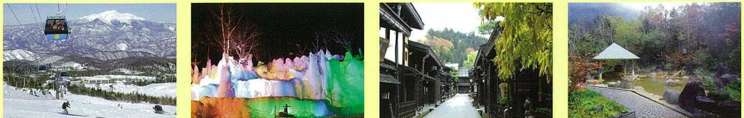
●チャオ御岳スノーリゾート【高山市高根町】 ●氷点下の森【高山市朝日町】 ●古い町並【高山市上三之町】 ●濁河温泉【下呂市小坂町】