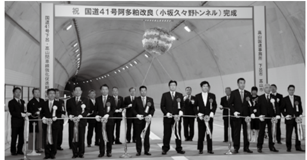
テープカットの様子

これまでの、国道41号に比べ、800メートルの短縮となり、大雨や積雪時にも安全に走行できるようになり、国道41号かさらに41(よい道)になりました。