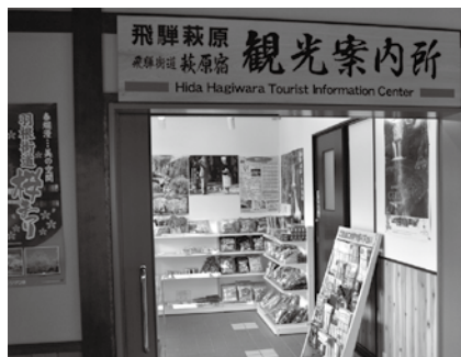
リニューアルされた飛騨萩原駅。地域の特産品などを販売

かつては賑わいを見せた駅が、時代とともに形を変え、地域の皆さんの手で生まれ変わりました。