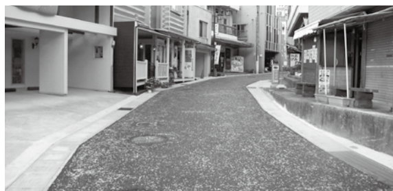
下呂温泉散策路修繕工事