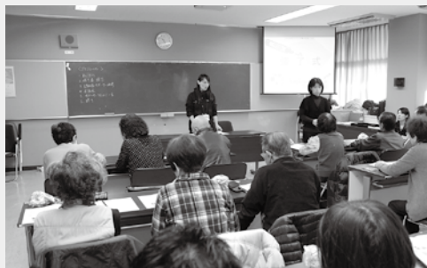
職員から講義を受ける参加者