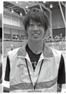
スムーズなゲーム進行が重要な オフィシャル係

「自分たちの部活動とは違い、大変なことばかりでしたが一流のプレーを目の前で見ることができ、とても楽しかったです。自分も国体選手と同じように、一流のプレーができるようになりたいです。」