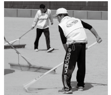
グラウンド整備に励んだ高校生

「益田清風高校野球部として、部員全員で協力しました。トップレベルの試合を間近で観戦できて良かった。僕たちも甲子園を目指して頑張ります。」