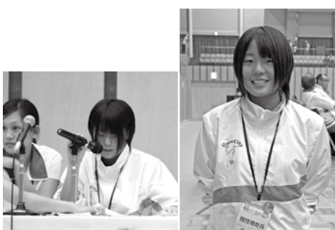
早い試合展開でも見事なアナウンス

「ただ原稿を読むというわけにはいかず、その場の状況に即アナウンスの内容が異なると大変なことばかりでした。でも、希望しても誰もが経験できることではないので、貴重な経験となりました。」