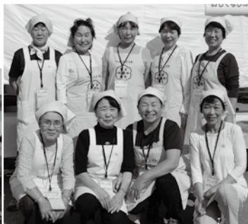
笑顔の絶えないヘルスメイト小坂支部のみなさん