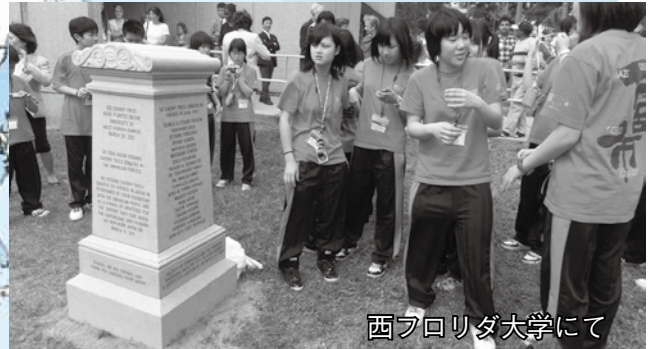
西フロリダ大学にて