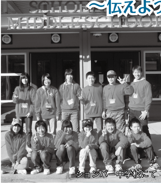
シオンバー中学校にて