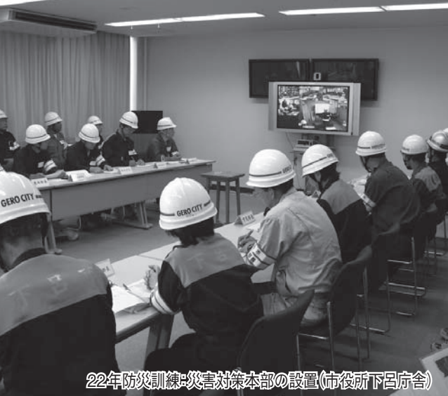
22年防災訓練：災害対策本部の設置(市役所下呂庁舎)

地震をはじめ天災はいつ起きるかわかりません。想定以上のことが起きる可能性もあります。今私たちが天災に対してできることは、『徹底的に準備すること』『訓練のための訓練ではなく、本番を想定した訓練をすること』だと感じました。