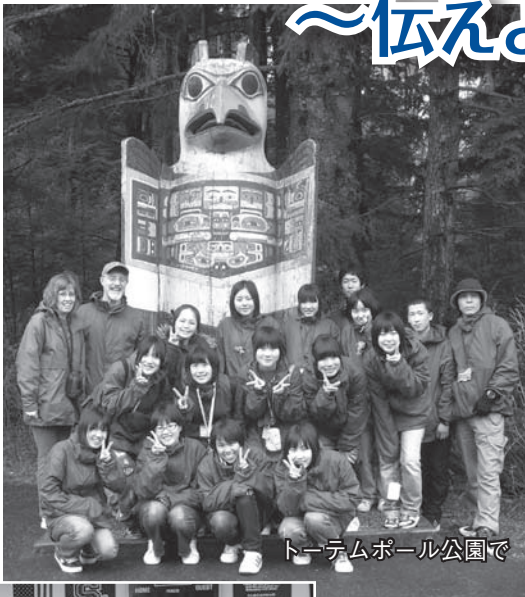
トーテムポール公園で

またケチカン市からの訪問団は、下呂市の派遣団員の各家庭にホームステイし、日本の生活様式や文化を学びました。こうした交流が引き継がれることで、さらに結び付きが深まっています。