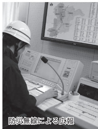
防災無線による広報

およそ6千人もの死者を出した阪神・淡路大震災を契機に、地域コミュニティと自主防災体制の重要性が認識されました。