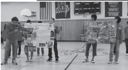
現地の中学生に東日本大震災を報告するケチカン派遣団員