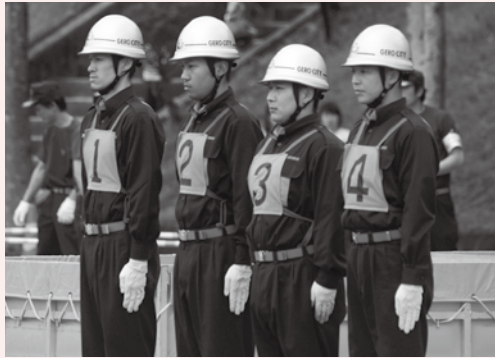
◆下呂市消防団 団員数(平成23年度) (人)

下呂市消防団では地域防災力の維持強化のため、団員の募集を随時行っています。今、「自分のまちは、自分で守る」若い力が必要です。みなさんの入団をお待ちしています!