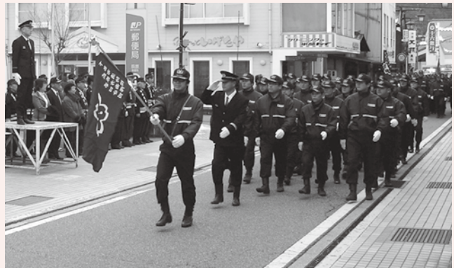
問合せ / 消防本部 ☎ 25-5119

萩原方面隊：1月8日(日) 11時00分～ 小坂方面隊：1月8日(日) 9時00分～ 下呂方面隊：1月8日(日) 10時45分～ 金山方面隊：1月5日(木) 9時40分～ 馬瀬方面隊：1月8日(日) 10時45分～