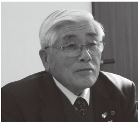
下呂市民生委員児童委員協議会長