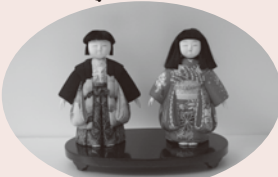
社会教育課 ☎ 52-2900