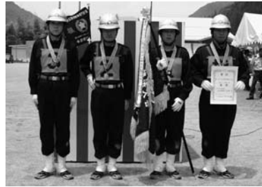
優勝の小坂方面隊第1分団（大垣内・無数原・門坂）