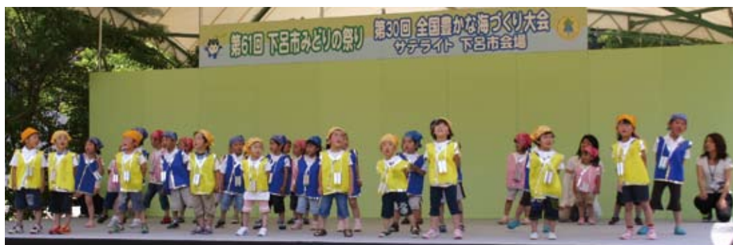
ステージイベントで元気に歌やダンスを披露するわかあゆ保育園の園児。

下呂市で開催された第57回全国植樹祭から4年。持続可能な森林づくりの大切さは、森、川、海が一体となった水環境保全の取り組み、そして「清流の国ぎふ」づくりへとつながっています。