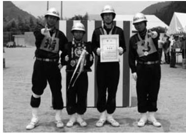
準優勝の下呂方面隊第2分団第4部（御殿野）