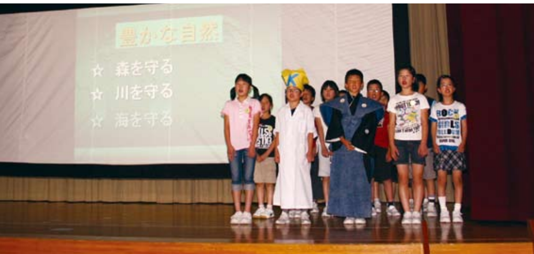
「海づくりは山づくりから」と学習成果を発表する馬瀬小の児童。