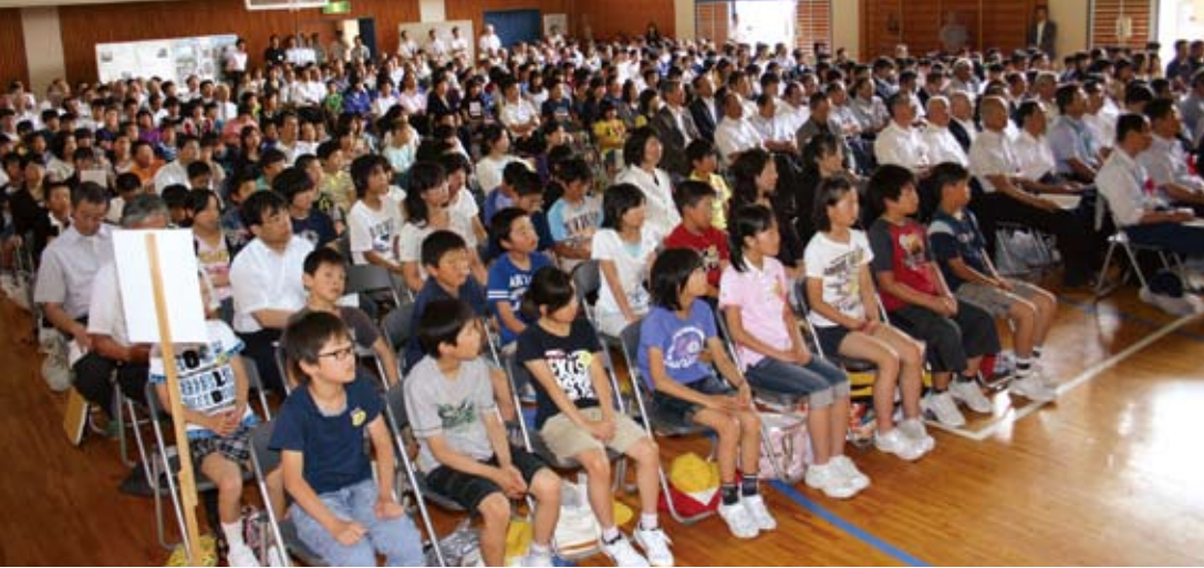
式典会場の旧総島小体育館に集まった大勢の市民。