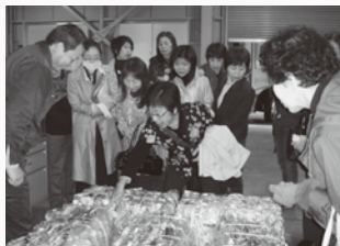
市クリーンセンター見学会で、ごみ処理方法の説明を聞く