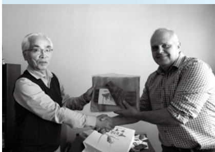
ケチカン市長と面談し握手を交わす市長