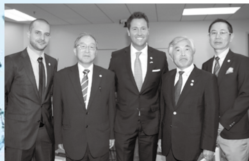
ペンサコーラ市長と面談し記念撮影する訪問団