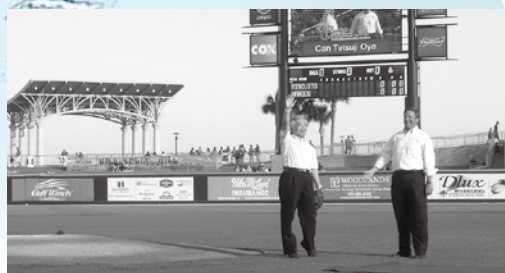
ベイフロントスタジアムで行われた野球の試合の始球式で下呂市をPRする教育長