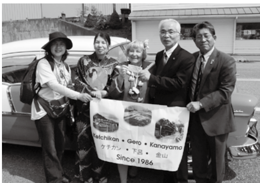
米国独立記念日のパレードに参加した訪問団