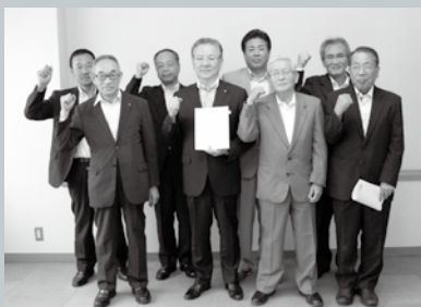
▲国の認定を受けたことを発表した市内の商工会長、十六銀行法人営業部長、益田信組専務理事、副市長＝6月25日・別館飛山

この支援事業は産業競争力強化法に基づき下呂市における「創業支援事業計画」が、国の認定を受けたもので、平成27年度から平成31年度まで実施します。本市における新たな創業をサポートすることにより、地域経済の活性化を目指すものです。