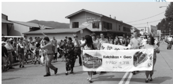
ケチカン市で行われた米国独立記念日のパレードの様子