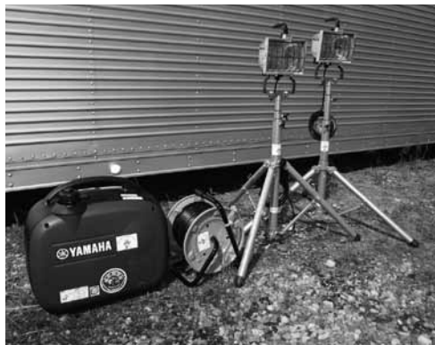
馬瀬地域自治会連合会が購入した資機材