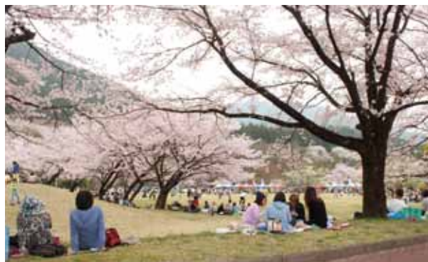
穏やかな陽気の中、満開の桜の木の下で花見を楽しむ皆さん ＝萩原町上呂、飛騨川公園

萩原町には桜の名所がたくさんありますが、その中の一つ飛騨川公園で「飛騨はぎわら桜まつり」がNPO法人萩原スポーツクラブの主催により開かれました。会場では、春一番さくら花見コンサートやミニSL、フリーマーケット、ストーンペインティング、ノルディックウォーキングなどイベントが盛りだくさん。満開に咲き誇る桜の下、参加者は思い思いの“桜”を楽しみました。