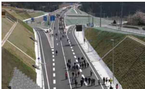
開通前に見物兼ねてウォーキングを楽しむイベント参加者 ＝金山町乙原、濃飛横断自動車道金山インターチェンジ

同日、郡上市でも同様のイベントが行われ、両地域の住民約400人が参加。全長約1.8kmのトンネルを含めた、約2.9kmのコースでウォーキングや記念写真の撮影を楽しみました。