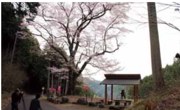
御嶽山を背景に満開の嶽見桜を撮影する方たち ＝金山町菅田笹洞、袋坂峠

良く晴れた日には桜越しに御嶽山を望むことができ、写真撮影を楽しむ方には、絶好のスポットとして人気があります。この日は、日頃から草刈りなど環境整備をしている地域住民組織の「峠の桜を守る会」が、駐車場案内やバザーを出店して、訪れた方をもてなしました。