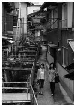
金山の筋骨めぐり▶

下呂市エコツーリズム推進協議会では、平成28年度に5回の会議を行い、各地域へのヒアリングやガイド講習会を実施しました。