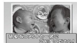
「G-BABY」写真募集のお知らせ