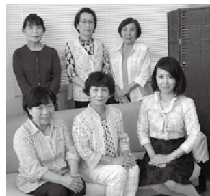
▲結婚相談員のみなさん

男性会員の E 君は、 優しくて真面目なとて もい人です。ずっと 応援してきました。素 敵な出会いがあって、 私も自分のことのように 嬉しく思っています。 他の会員さんにも良い ご縁がありますように、 寄り添って力になれる よう活動しています。 結婚を希望する気持 ちがある人は、待って いるだけでなく、自分 から行動し てもらいた いと思いま す。