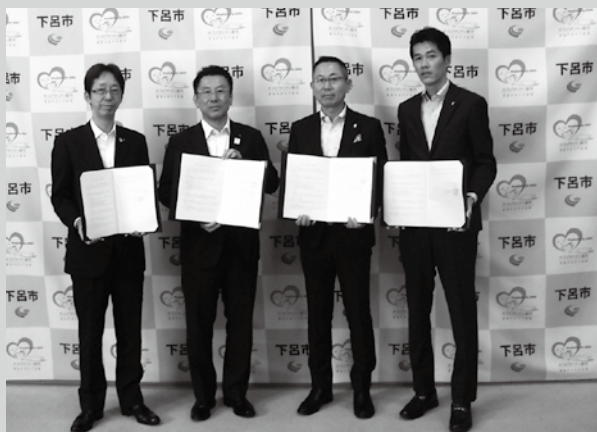
▲ 8月31日、この取り組みに対する協定が結ばれました＝萩原町萩原、星雲会館

生命保険会社と市が、それぞれの立場から相互に連携・協力して、市民の健康づくりに関する取り組みを推進し、市民の健康寿命の延伸を図っていきます。