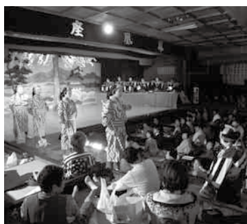
▲鳳凰座歌舞伎定期公演＝御厩野

「エコツーリズム」によるそれぞれ地域での観光を、「DMO」により連携・協力して地域一体化を図り、下呂市全体を潤す仕組みのこと。