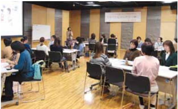
お菓子とコーヒーでカフェ気分を味わい和やかな雰囲気の中、講師からグループ討論の説明を受ける参加者=森、下呂交流会館

NPO法人みらいろが「子育てしながら社会で輝く」をテーマに、「これからの女性の働く場づくりを学ぶセミナー」を催しました。NPO法人みらいろは、市内在住の子育て世代の女性を中心に構成され、女性の働き方改革や交流の場づくり、下呂市の魅力発信といった活動をしています。参加者は、基調講演やグループ討論で、仕事と生活の調和について理解を深めました。