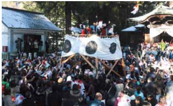
やぐらから投げ落とされる「寄進笠」を求め、手を伸ばす見物客=森、森水無八幡神社

稲の豊作を祈願する森水無八幡神社の例祭「田の神まつり」が行われました。田遊びが由来とされ、神主と踊り子と呼ばれる4人の若者が色鮮やかな花笠をかぶって、竹製のささらで音を鳴らす独特な花笠踊りを披露しました。高さ約4メートルのやぐらからは、手にすると1年が幸せに過ごせるとされる縁起物「寄進笠」が投げ込まれ、大勢の見物客で取り合いました。