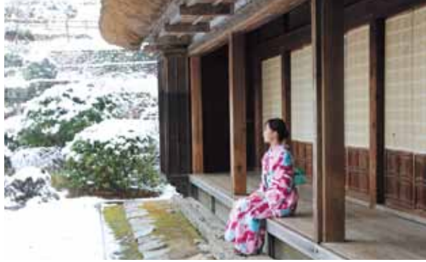
和服を着て散策すれば、いつもとは違った雰囲気を楽しめます。インスタ映えすること間違いなしです。=森、下呂温泉合掌村

下呂温泉合掌村では、着物のレンタルと着付けをセットにしたサービスを行っています。30種類の中から好きな着物を選択し、先生が丁寧に着付けてくれます。帯や下駄、髪飾り、ストールなどもセット。手ぶらでも、気軽に和の装いをして合掌村や下呂温泉街の散策が楽しめます。料金は女性3,000円～、男性4,000円～、要予約、5月まで実施(表紙記事)