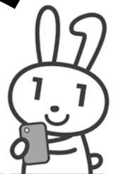
マイナンバーPRマスコットキャラクター マイナちゃん

マイナンバーカード（個人番号カード）は、12桁の個人番号が入ったプラスチック製のカードで、身分証明書として使用できるだけでなく、さまざまな機能が備わっています。マイナンバーカードを申請する方法や、今年度からサービスがスタートするマイナポイントなどのお得な使い方をご紹介します。