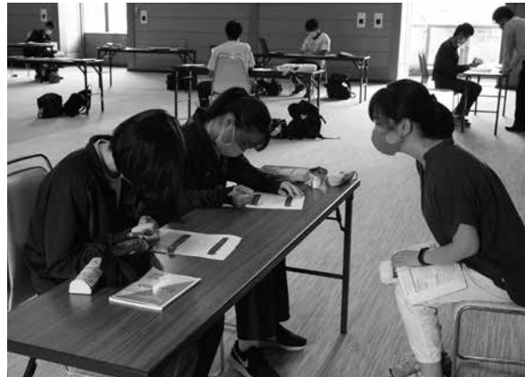
▲教員の指導のもと英語を学ぶ生徒たち＝星雲会館

令和2年7月豪雨の影響で鉄道やバスが運休となり、通学が困難となった高山西高校生徒のために、星雲会館にてサテライト教室が開設されました。利用者は下呂市在住の生徒10名ほどで、前日の授業内容をパソコンで視聴、分からないことは教員に質問していました。受験勉強の遅れや精神的負担が心配される中、生徒からは「自分のペースで勉強しやすい」という意見があり、できることに懸命に取り組む前向きな姿が見られました。