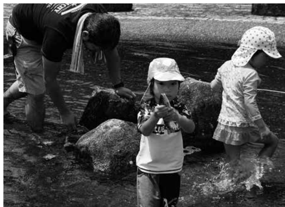
▲あまごつかみどりを体験中＝水辺の館(馬瀬西村)

新型コロナウイルスの感染拡大により外出の機会が減った子どもたちに、市内で楽しんでもらおうと市内の20種類以上の観光体験メニューが特別価格で体験できる「下呂であそぼう」を開催中です。この日、あまごつかみどり体験に地元の家族が挑戦。つかみどりは初めてということで、動きの速いあまごに最初は苦戦していましたが、徐々に上達し楽しく体験を終えました。「下呂であそぼう」は9月30日まで。詳細は上のQRコードをご確認ください。