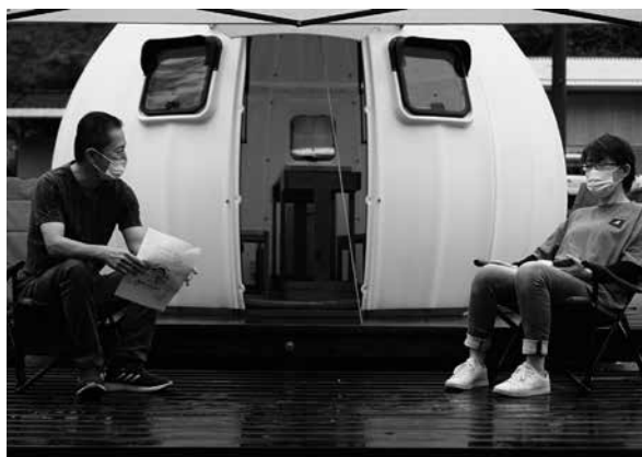
▲ドームハウスの前で語り合う見学者＝まるかりの里(久野川)