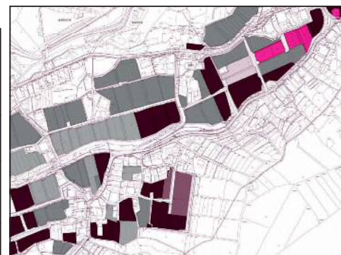
↑耕作者の年齢・意向別に色塗りした地図