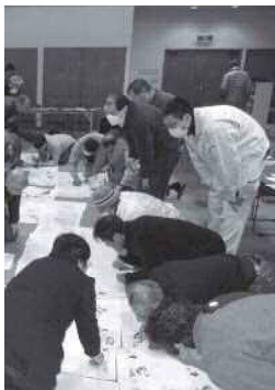
農事改良組合長会議