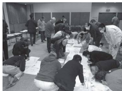
↑地図による現況把握（農事改良組合長会議）