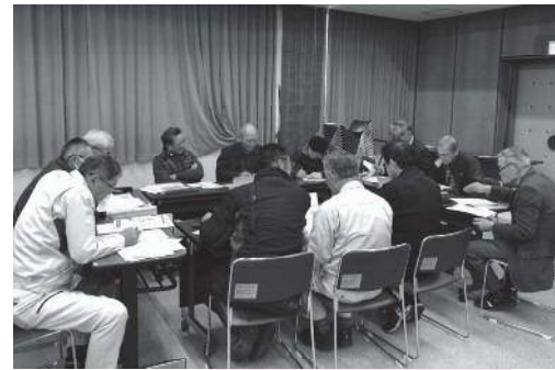
↑多面的機能支払交付金の活動組織と農業委員のプラン検討会議