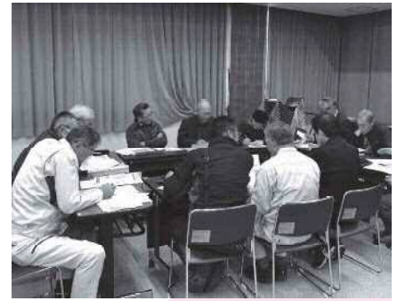
↑ 多面的機能支払交付金の活動組織と農業委員のプラン検討会議