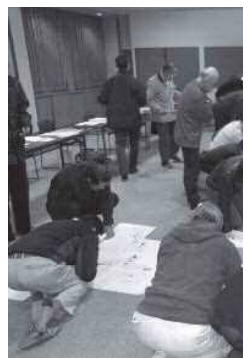
↑ 地図による現況把握(農)