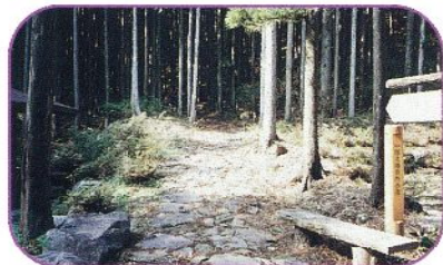
■旧官道の石畳(匠の道)