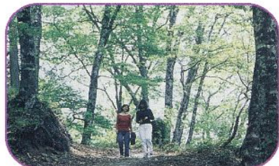
■新緑の「光と風の道」