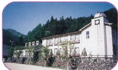
■「自然体験活動の拠点・位山自然の家」 「丘の上の校舎」と高石ともやさんが歌い上げた山之口小学校は、位山自然の家(宿泊研修施設)へと生まれ変わりました。森林浴、バードウォッチング、スターウォッチングなど、豊かな自然空間での感動体験活動の拠点です。 ○利用申込み: 下呂市教育委員会 ☎0576-52-2900

■■■■■ → コース1 初心者向きコース 片道 6.6km 所要時間 片道2時間 ■■■■■ → コース2 初心者・家族向きコース 周回 3.7km 所要時間 3時間