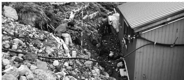
御嶽山五の池小屋裏に山留工を計画(写真は7月撮影)