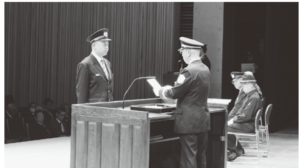
団長から辞令書を受け取る消防団員

4月1日、下呂交流会館において、平成31年度下呂市消防団入退団式が挙行されました。今年度の入団者は、新入団員39人、支援団員5人、合計44人です。また、退団者は団員67人、支援団員8人、合計75人でした。総員は、昨年度より31人少ない1,147人となります。式典では消防団員として長年在籍され、活躍された団員の方々に表彰状がそれぞれ授与されました。