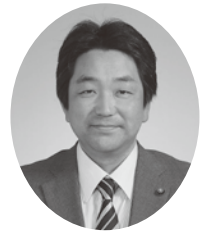
1 番 尾里集務議員