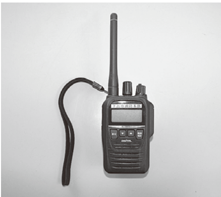
消防団に配備するデジタル式無線機

A 現在の防災行政無線はアナログ式で1波(1チャンネル)での運用となっています。複数の人が同時に使用すると混信してしましました。今回購入する簡易型のデジタル無線機は65チャンネルあり、切り替えることで用途別に交信ができます。