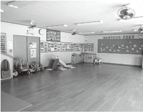
エアコンの設置を予定している北児童館遊戯室