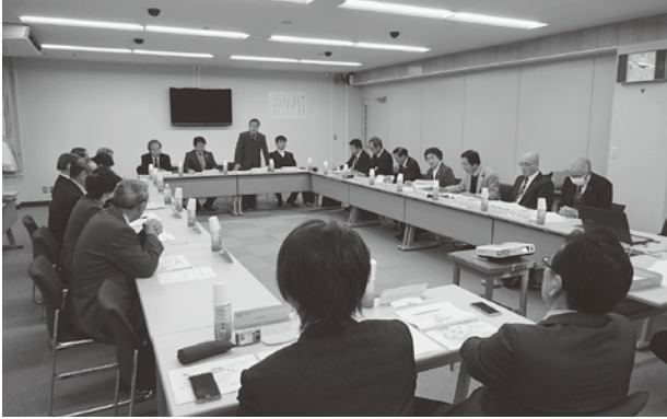
勉強会を行う郡上市議会と下呂市議会の委員

勉強会では、岐阜県郡上土木事務所職員から堀越峠の工事の進捗状況と、今後について説明がありました。その後、委員相互で意見交換を行い、濃飛横断自動車道の早期整備促進について確認しました。