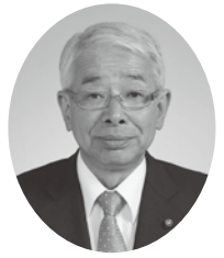
3 番 田中副武議員 (公明党)