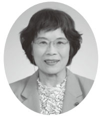
11 番 吾郷孝枝議員 (日本共産党)