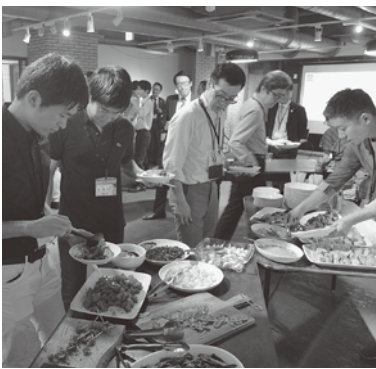
下呂の食材を東京都内でPR (平成30年10月千代田区)

関係機関からの情報収集や都内で行われる移住定住関連のセミナーなどへの参加のほか、首都圏在住の観光大使や地元出身の学生、社会人の方々との関係強化を図っています。今年ラグビーワールドカップ、来年には東京オリンピック・パラリンピックが開催されます。下呂市の魅力を発信し、交流人口の増加に努めていきます。