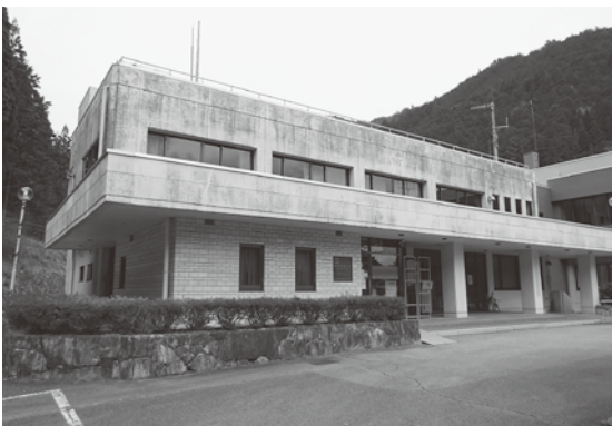
平成31年度解体予定の旧馬瀬振興事務所

地域再生計画および庁舎・振興事務所整備の進捗状況について、執行部から説明がありました。地域再生計画は、昨年の豪雨の災害復旧の関係で、1年延伸することの説明がありました。庁舎・振興事務所整備では、整備工事が一区切りとなり、新年度は旧馬瀬振興事務所の解体工事を予定していると説明がありました。