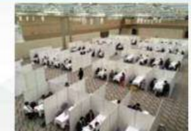
ビジネス・サミット2018 個別商談会の様子