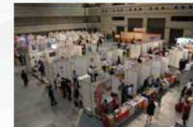
ビジネス・サミット2018 展示会の様子

2018年5月の開催時は東海・北陸地方から展示会は113社、個別商談会は154社の食品サプライヤー企業が参加しました。