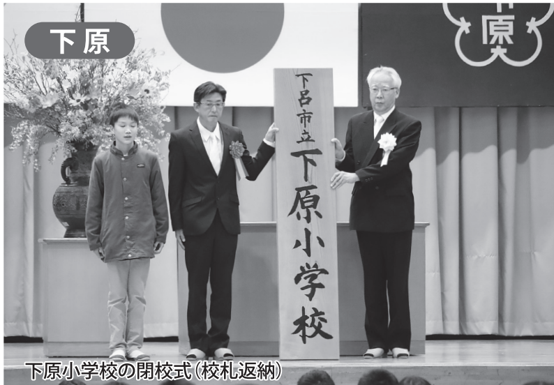
下原小学校の閉校式(校札返納)

下呂市金山町にある4つの小学校が、令和3年4月から1校に統合されました。 各小学校の長い歴史に幕が下ろされ、それぞれの思い出を胸に児童たちは、新しい環境で始まる学校生活に向けて力強く羽ばたいています。