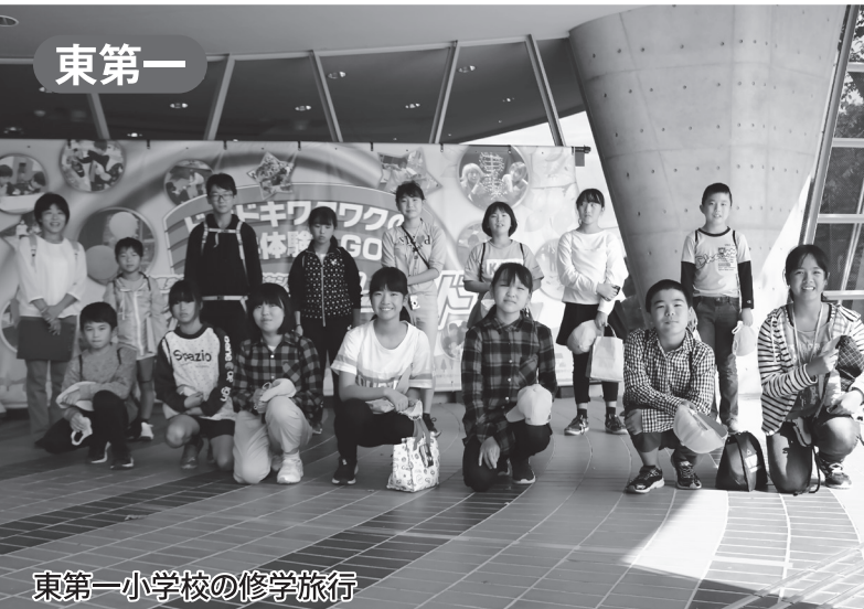
東第一小学校の修学旅行