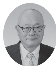
3 番 飯塚英夫議員 (日本共産党)