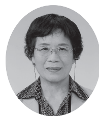
12 番 吾郷孝枝議員 (日本共産党)