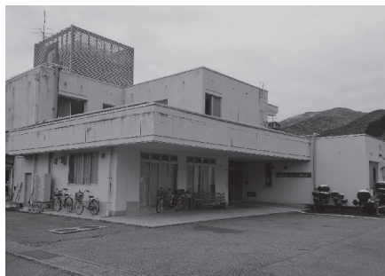
飛騨川沿いに位置するあさぎりサニーランド

A 現施設の場所については、安全性という面で大きな課題となっています。今ある場所で浸水があっても利用される方々に危険が及ばない形で建替えする方法や、全く他の安全な場所を求めて新築する方法など、幾つかの考え方がありますが、そういった根本的な対策は、今後の検討となります。