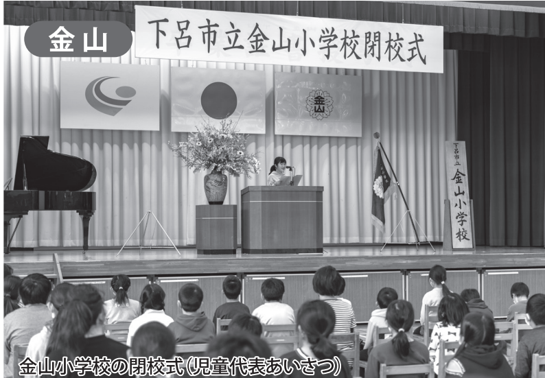
金山小学校の閉校式(児童代表あいさつ)