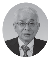
8 番 田中副武議員 (公明党)