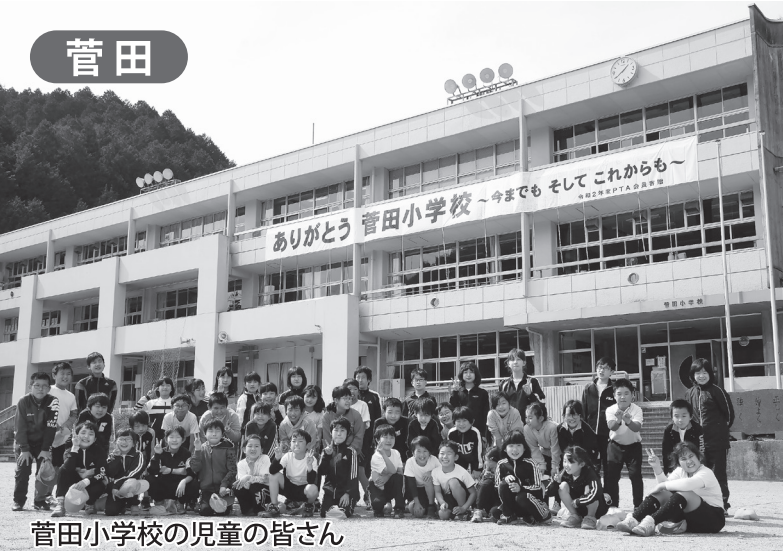
菅田小学校の児童の皆さん