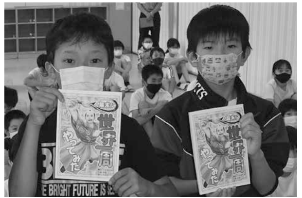
▲漫画を受け取った金山小の児童たち = 金山小学校

「加藤素毛（かとうそもう）」は幕末～明治を生きた金山町下原町出身の俳人です。1860年、日米修好通商条約批准書交換を目的としたアメリカへの使節団の一員として、日本人初の世界一周を成し遂げました。こういった偉大な功績を後継者に伝えていくため、加藤素毛伝承事業実行委員会が中心となり、実話をもとにした漫画が作成されました。完成した漫画は、市内の学校・図書館などに配布し、代表として金山小学校で贈呈式を行いました。