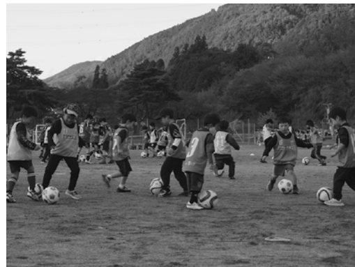
▽昨年のサッカー教室の様子▽

FC岐阜の選手、スクールコーチによる子どもサッカー教室を開催します。今年は参加者全員に、ハンドタオルとクリアファイルのプレゼントがあります。初心者大歓迎です！ ※新型コロナウイルスの感染状況により、予定が変更になる可能性があります。ご了承ください。