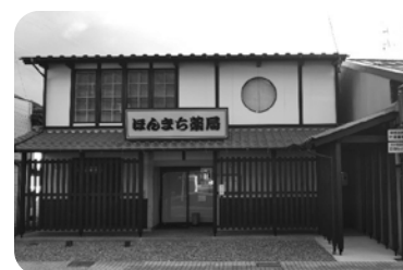
令和2年度・建築物の部受賞 「ユニファーマシーほんまち薬局」