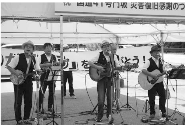
▲曲を演奏するGoo連帯の皆さん = 小坂町門坂