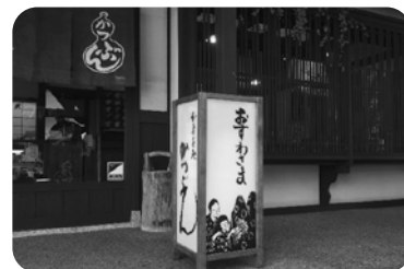
令和2年度・屋外広告物の部受賞 「かつぶん」

応募先 〒509-2506 下呂市萩原町羽根2605番地1 下呂市役所 建設部 建設総務課