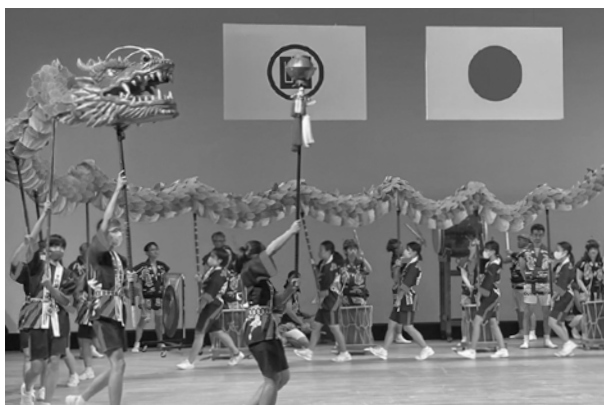
▲演舞を披露する中学生・高校生=下呂交流会館