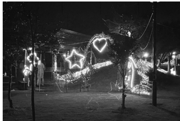
▲ライトアップされたきこり公園=小坂町大島

小坂町大島にあるきこり公園で、1万球のLEDを使ったイルミネーションが点灯されました。地元住民でつくる「大島夢の会」が毎年、夏休みや年末年始などに点灯しているイベントで、光の回廊やイルミネーションで飾った丘などが用意され、7月25日の点灯式から8月末までの期間中、地域住民の目を楽しませました。