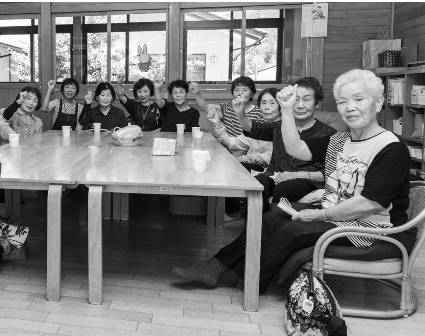
▲「ほのぼの館」に集まった住民と「ほのぼの館」を運営する「ほのぼの会」の皆さん＝わかあゆ子育て・保育ステーション