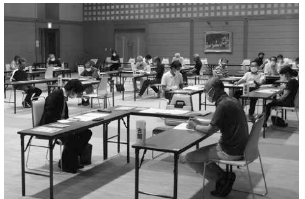
▲振興事務所からの説明を聞く参加者 = 星雲会館

萩原地域では毎年、総合防災訓練に向けて自治会、消防団、民生委員児童委員が集まり、訓練内容の確認や意見交換を行う「萩原地域 自治会・消防団・民生児童委員合同防災会議」が開催されます。今年度は新型コロナウイルス感染防止対策として、萩原地域を南北で区切り2日間に分け開催しました。近年は下呂市でも災害発生の危険が増しており、自分の命を守るための日頃の準備、区や市内で行われる訓練への参加が大切です。