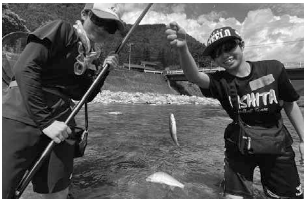
▲アユを釣り上げた益田清風高校生徒たち = 馬瀬川(馬瀬数河)