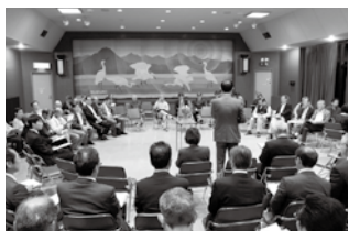
▲昨年の市政懇談会の様子 ＝森、下呂市民会館

※提案者が当日欠席される場合には会場にお見えの人の意見提言を優先する場合があります。