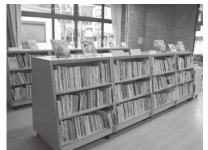
▲新着本など種類豊富に本がそろっている図書館。本が好きでよく図書館に本を読みに来る子どもたち（写真上）

定しています。来館者にしてのプレゼントや県内各図書館と連携したスタンプラリー、リサイクル市など盛りだくさんです。