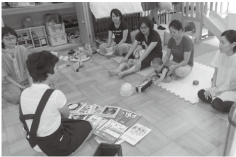
▲赤ちゃんとそのお母さんへ読み聞かせをする「～子育て講話～読み聞かせ&絵本講座」の様子