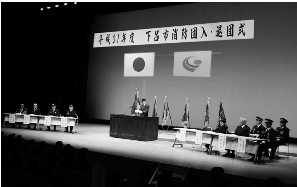
▶ 式台上に登壇し式辞を述べる市長