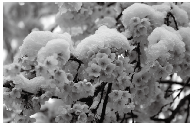
▲満開の桜に雪が積もった様子＝萩原町上村

下呂、萩原地域の桜は、8日前後に見ごろを迎えていましたが、10日に季節はずれの雪が降ったため、満開の桜に雪の帽子をかぶったような面白い光景が広がりました。桜に雪が積もる「雪桜」はとても珍しい現象で、普段とは一味違った桜の景色を楽しめました。