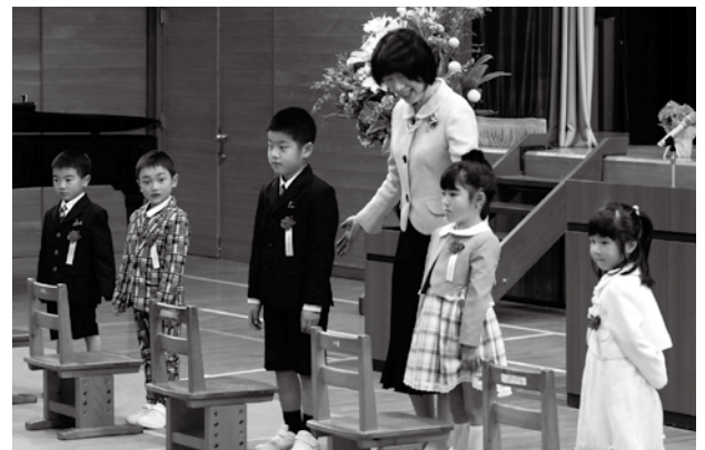
▲少し緊張した様子の5人の新1年生＝馬瀬小学校

慣れない雰囲気に対し緊張した様子の5人でしたが、名前を呼ばれると「はいっ！」と元気に返事をし、これから始まる新しい学校生活のスタートを切りました。