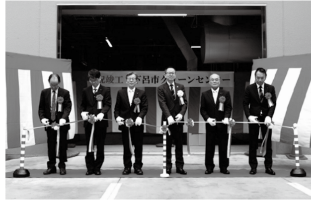
▲竣工式テープカットの様子＝下呂市クリーンセンター

新クリーンセンターでは、24時間で30トンのごみ処理が行える焼却炉を2基備え、可燃ごみの焼却だけでなく、汚泥の処理も可能です。排出ガスについても基準値を大きく下回り、余熱を給湯や暖房、ロードヒーティングに利用するなど環境に配慮した施設となっています。