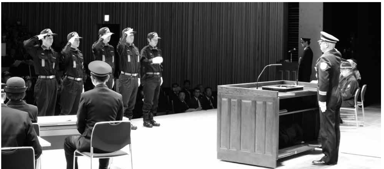
▶辞令受領のため、無笹団長へ敬礼する新入団員

結びに、今年度1カ月で元号が変わりますが、私たちの使命は変わりません。これからも全ての災害において、公務災害なく迅速に対応できることと、元気に活動できることを願い、訓示とします。