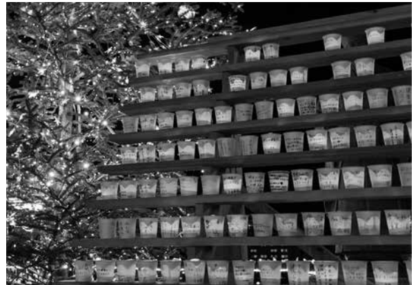
▲スタンドに並べられた願い事が書かれたキャンドルカップ ＝湯之島白鷺橋周辺

スタンドには、「健康で過ごせますように」「平和が続きますように」など、観光客らの思いの願い事が記されたキャンドルカップがずらりと並び、聖夜の温泉街にゆらゆらと揺れる優しい明かりが灯りました。