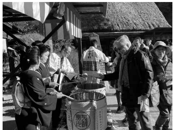
▲来場者へ祝いの酒を振る舞う芸妓さんら＝下呂温泉合掌村

芸妓さんが振る舞う清酒は「福寿を招く」といわれる縁起物で、1年の始まりを祝い、来場者へ新年最初のおもてなしをしました。